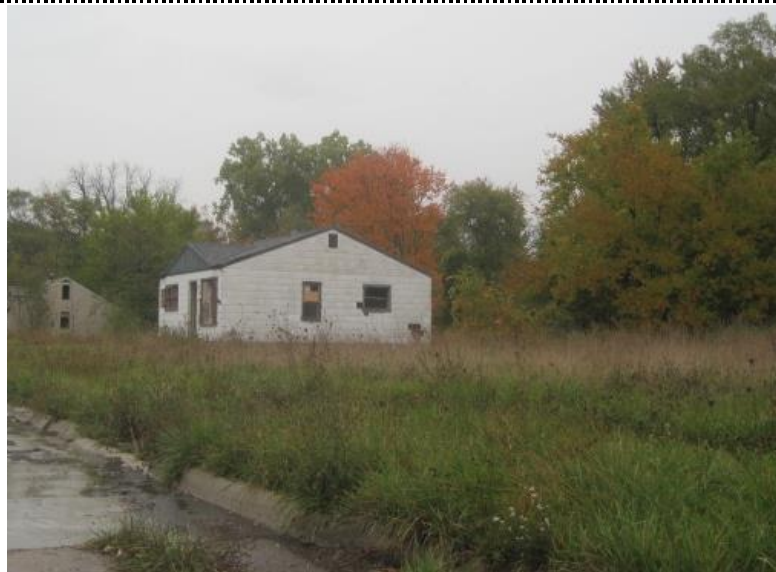
空き家・空き地だらけとなった地区□ Detroit, photo by Yasuyuki Fujii, 2013□