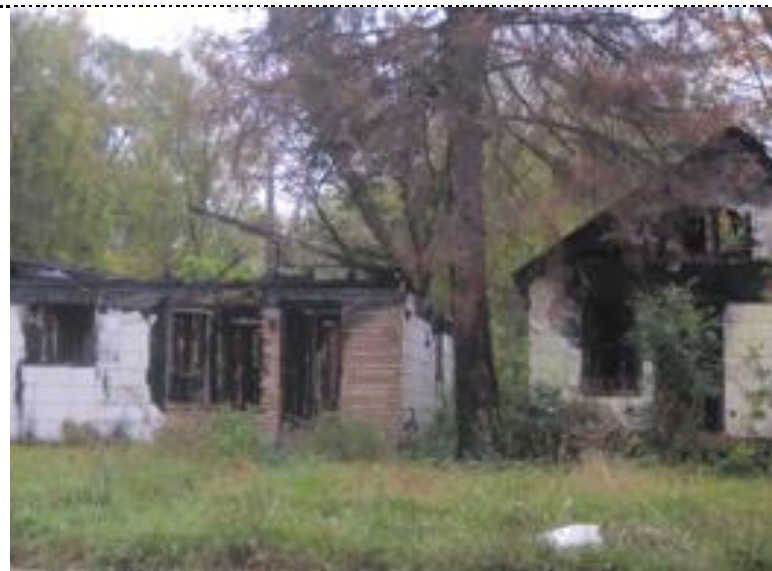
放火にあったとみられる空き家□ Detroit, photo by Yasuyuki Fujii, 2013□