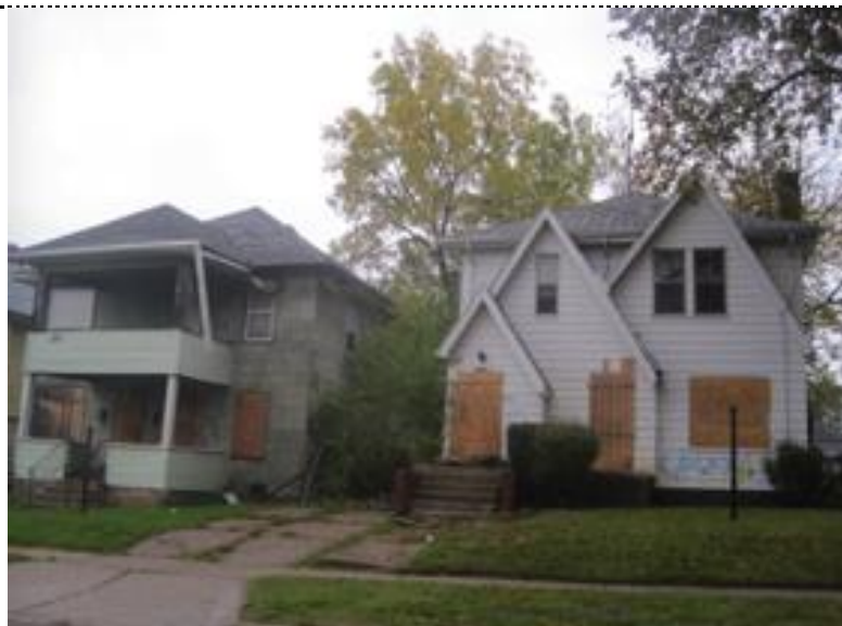
開口部封鎖（ボードアップ）された空き家□ Flint, photo by Yasuyuki Fujii, 2013