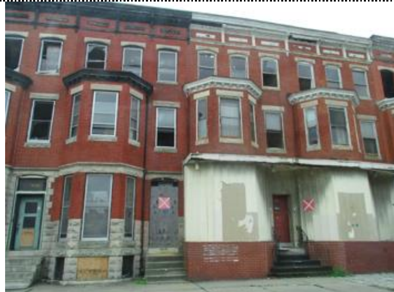
開口部封鎖（ボードアップ）された連棟住宅□ Baltimore, photo by Yasuyuki Fujii, 2016□